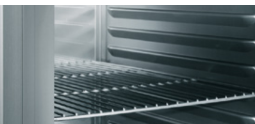
90mm d'isolation, intérieur hygiénique avec glissières embouties (gamme 570 MAGNOS/ 590 MELIOS)