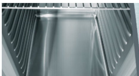
Cuve emboutie avec rayons hygiéniques (570 MAGNOS / 590 MELIOS)